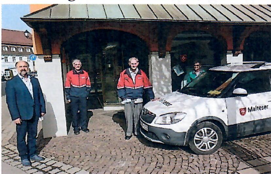
Begleitende Fahrten der Malteser

Wie in den vergangenen Jahren bezuschusste die Bürgerstiftung die begleitenden Fahrten des Malteser Hilfsdienstes e.V. in Stockach für Menschen, die nicht mehr in der Lage sind, zum Arzt, zu Behandlungen oder zu Versorgungen zu kommen.