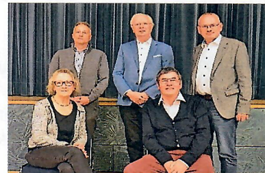
Beirat der Bürgerstiftung